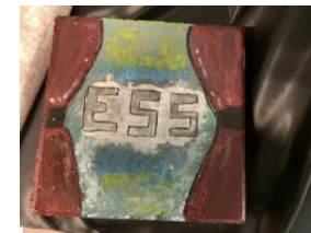
Vorhang auf, ESS!