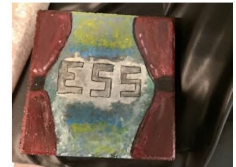
Vorhang auf, ESS!